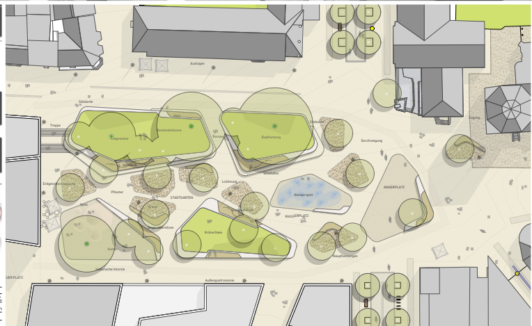
oben: Visualisierung Rahmenplan, unten links: Rahmenplan